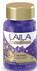
LAILA DORMIBENE 30 pastiglie gommose gusto frutti di bosco