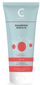
SHAMPOO DOCCIA ATTIVO 200 ml