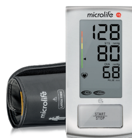
MICROLIFE AFIB ADVANCED EASY Misuratore della pressione