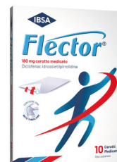
FLECTOR 180 mg 10 cerotti medicati