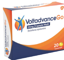
VOLTADVANCEGO 25 mg 20 capsule molli