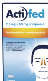
ACTIFED 2,5 mg + 60 mg 12 compresse