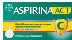
ASPIRINA ACT 800 mg | 480 mg 10 compresse effervescenti