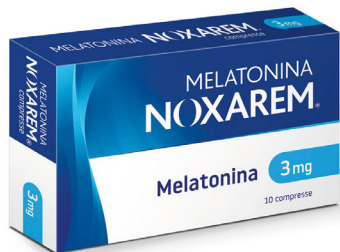
NOXAREM MELATONINA 10 compresse 3 mg