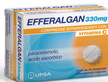
EFFERALGAN 330 mg 20 compresse effervescenti con vitamina C