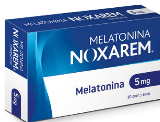
NOXAREM MELATONINA 10 compresse 5 mg