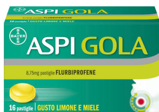
ASPI GOLA 8,75 mg • 16 pastiglie gusto limone e miele • ASPIGOLADOL 16 pastiglie gusto arancia