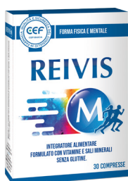
REIVIS FORMA FISICA E MENTALE 30 compresse