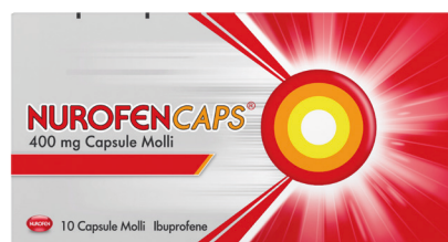
NUROFENCAPS 400 mg 10 capsule molli