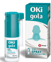
OKI GOLA • 0,16% spray 15 ml • 1,6% collutorio 150 ml