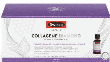
SWISSE COLLAGENE DIAMOND 10 flaconcini 30 ml