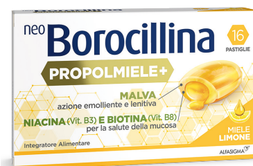
NEOBOROCILLINA PROPOLMIELE+ 16 pastiglie gusto miele limone