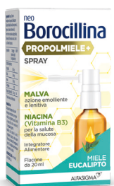
NEOBOROCILLINA PROPOLMIELE+ Spray flacone da 20 ml gusto miele eucalipto