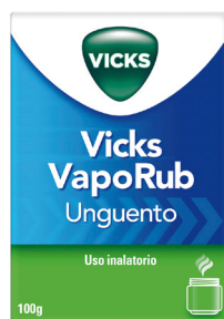
VICKS VAPORUB UNGUENTO Uso inalatorio 100 g