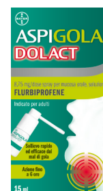
ASPI GOLA DOLACT 8,75 mg/DOSE Spray 15 ml