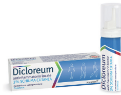
DICLOREAM ANTINFIAMMATORIO LOCALE 3% schiuma cutanea 50 g