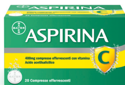
ASPIRINA C 400+240 mg 20 compresse effervescenti