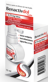
BENACTIVDOL GOLA 8,75 mg/DOSE • Spray 15 ml • BENACTIVDOLMED spray 15 ml gusto limone e miele