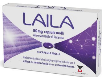
LAILA 80 mg 14 capsule molli