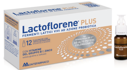
LACTOFLORENE PLUS 12 flaconcini