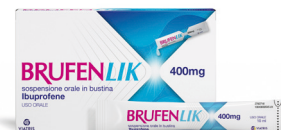
BRUFENLIK 400 mg 20 bustine 10 ml