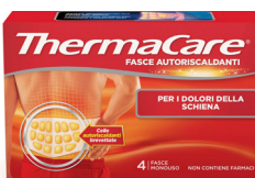
THERMACARE • Schiena 4 fasce monouso • Collo/spalla/polso 6 fasce monouso