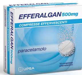
EFFERALGAN 500 mg 16 compresse effervescenti