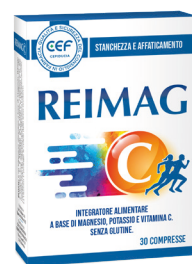
REIMAG STANCHEZZA E AFFATICAMENTO 30 compresse