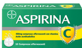
ASPIRINA C 400+240 mg 10 compresse effervescenti