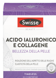
SWISSE BELLEZZA DELLA PELLE 30 compresse