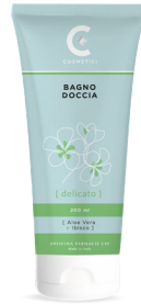
BAGNO DOCCIA DELICATO 200 ml