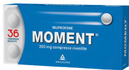
MOMENT 200 mg 36 compresse rivestite