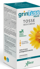
GRINTUSS • Adulti sciroppo 180 g • Pediatrico sciroppo 180 g