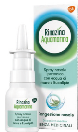
RINAZINA AQUAMARINA Spray nasale ipertonico 20 ml